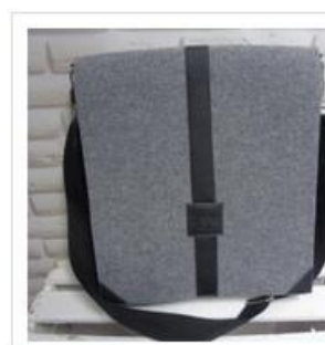
Torba filcowa meska