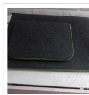
Pokrowiec na laptopa