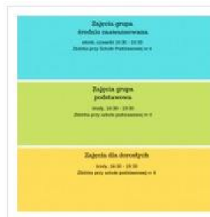
Nauka żeglowania organizo...