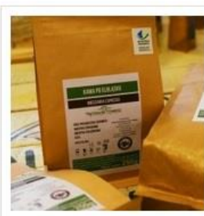
Kawa po elbląsku