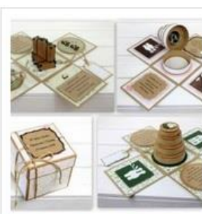
Exploding box na życzenie.