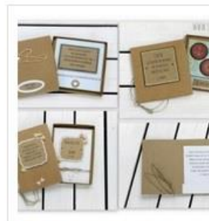
Kartka w pudełku na